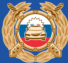
Госавтоинспекция МВД России

Буклет изготовлен по заказу Минпросвещения России в рамках реализации федеральной целевой программы «Повышение безопасности дорожного движения в 2013–2020 годах».